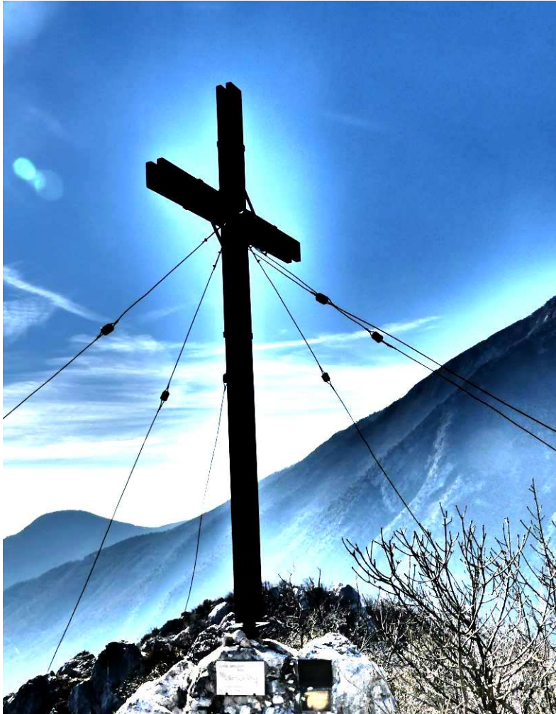
Monte Castello di Gaino